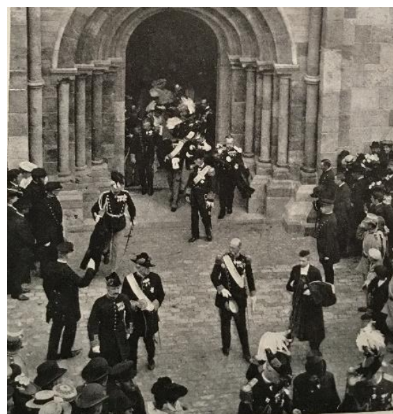
Fortalt af Ribe Kirkegårdes Fortællegruppe

● Gravstedet nedlagt, gravstenen derefter i lapidariet. ● Senere hertil